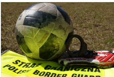
Chcieli grać w piłkę nożną na Podhalu, ale muszą wrócić do Brazylii

Przypominamy, że każdy cudzoziemiec wykonujący pracę zarobkową w Polsce - również jako piłkarz - oprócz uregulowania kwestii cywilnoprawnych z pracodawcą - musi posiadać odpowiednie dokumenty, by legalnie przebywać w Polsce oraz zezwolenia niezbędne do wykonywania tejże pracy w RP.