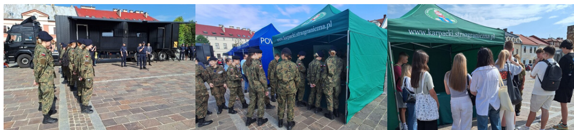
Projekt edukacyjny z udziałem funkcjonariuszy KaOSG

Funkcjonariusze Karpackiego Oddziału SG przygotowali stoisko promocyjne, które cieszyło się dużym zainteresowaniem wśród młodzieży. Odwiedzający, mogli uzyskać informacje na temat naboru do służby w Straży Granicznej jak również samej specyfiki służby w SG.