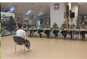
Z chęcią aplikują do Straży Granicznej