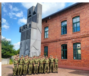
Z chęcią aplikują do Straży Granicznej