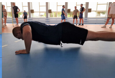
Z chęcią aplikują do Straży Granicznej