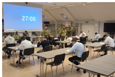
Z chęcią aplikują do Straży Granicznej

https://bip.karpacki.strazgraniczna.pl/s09/rekrutacja-do-sluzby-w/9965,NABOR-DO-SLUZBY-PRZYGOTOWAWCZEJ-W-KARPACKIM-ODDZIALE-SG.html