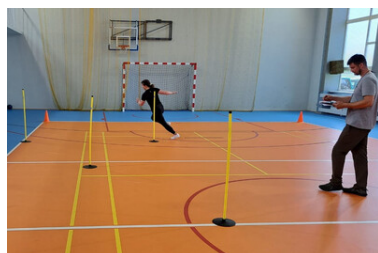
Z chęcią aplikują do Straży Granicznej