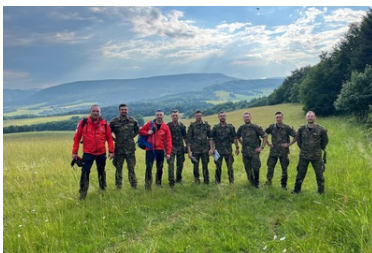
Wspólne szkolenie KaOSG i GOPR