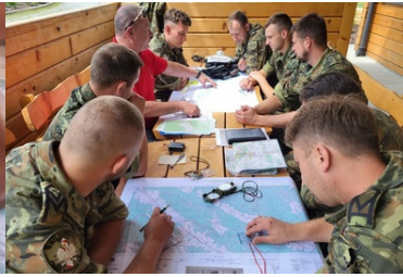
Wspólne szkolenie KaOSG i GOPR