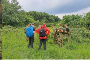
Wspólne szkolenie KaOSG i GOPR