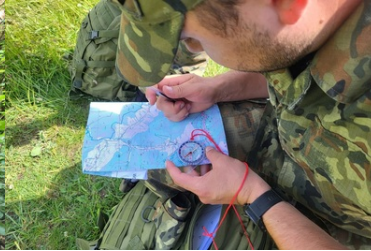
Wspólne szkolenie KaOSG i GOPR