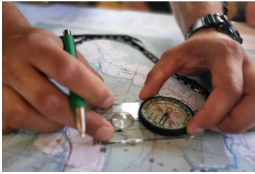
Wspólne szkolenie KaOSG i GOPR

takich działań ale również bezpośrednio wpłyną na bezpieczeństwo samych funkcjonariuszy.