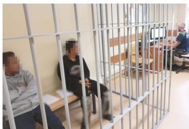
Indonezyjczycy nielegalnie wykonywali pracę w powiecie suskim

W związku z powyższym Komendant Placówki SG w Zakopanem z urzędu wszczął postępowania administracyjne w sprawie zobowiązania cudzoziemców do powrotu, a następnie wydał decyzje zobowiązujące obywateli Indonezji do powrotu z zakazem ponownego wjazdu do Polski i strefy Schengen przez okres 1 roku.