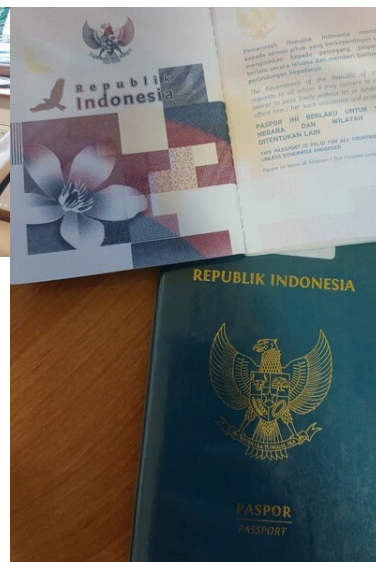
Indonezyjczycy nielegalnie wykonywali pracę w powiecie suskim