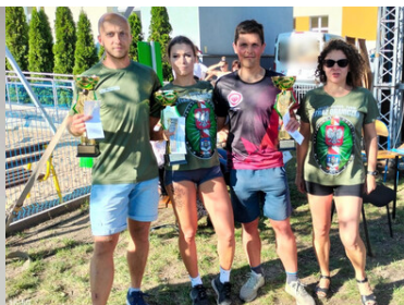
Dla Karpackiego Oddziału Straży Granicznej zdobył Mistrzostwo Wielkopolski