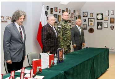
"Książka, która wyruszyła na wojnę" wróciła do koszar przy ul. 1 Pułku Strzelców Podhalańskich po 85 latach

Przekazana - znakomicie zachowana - książka będzie eksponatem w Sali Tradycji, w której zgromadzone i udostępnione są materiały historyczne związane z formacjami granicznymi, począwszy od 1 Pułku Strzelców Podhalańskich, którego imię nosi Karpacki Oddział Straży Granicznej.