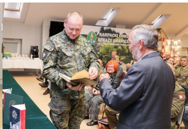
"Książka, która wyruszyła na wojnę" wróciła do koszar przy ul. 1 Pułku Strzelców Podhalańskich po 85 latach