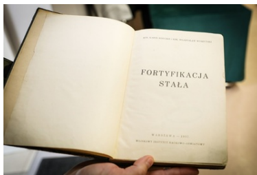
"Książka, która wyruszyła na wojnę" wróciła do koszar przy ul. 1 Pułku Strzelców Podhalańskich po 85 latach