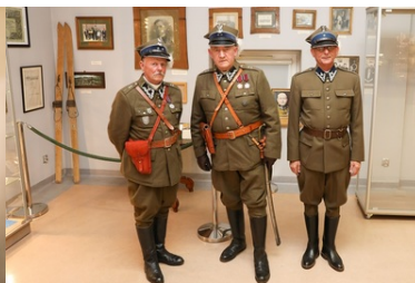
"Książka, która wyruszyła na wojnę" wróciła do koszar przy ul. 1 Pułku Strzelców Podhalańskich po 85 latach