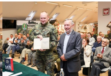
"Książka, która wyruszyła na wojnę" wróciła do koszar przy ul. 1 Pułku Strzelców Podhalańskich po 85 latach