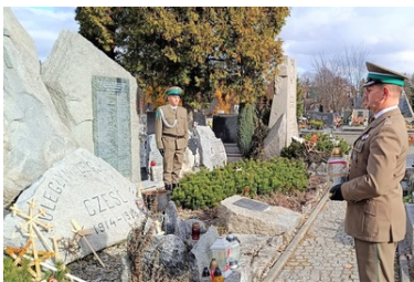
Karpacki Oddział Straży Granicznej pamięta o tych, którzy odeszli

Cmentarz komunalny w Lubaczowie - grób śp. płk. Przemysława Nakoniecznikoffa-Klukowskiego, patrona Placówki Straży Granicznej w Kielcach.