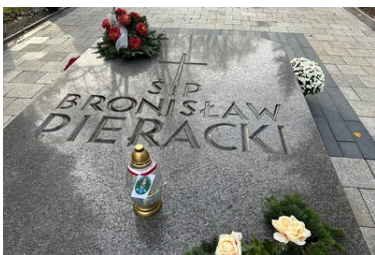
Karpacki Oddział Straży Granicznej pamięta o tych, którzy odeszli

Odwiedziny na grobach zasłużonych dla Ojczyzny Polaków, to wyraz patriotyzmu i przywiązania do tradycji. Takie wizyty przypominają o ich znaczeniu dla państwa, służby i obywateli. Pokazują też, że służba w obronie granic RP ma długie tradycje i jest kontynuowana przez kolejne pokolenia.