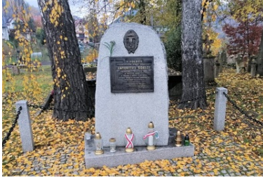
Karpacki Oddział Straży Granicznej pamięta o tych, którzy odeszli

Stary Cmentarz parafialny w Piwnicznej - obelisk upamiętniający Antoniego Sidełko, podoficera żołnierza Straży Granicznej, który 1 września 1939 r. zginął na posterunku granicznym. Był on prawdopodobnie pierwszą ofiarą II wojny światowej na Ziemi Sądeckiej.