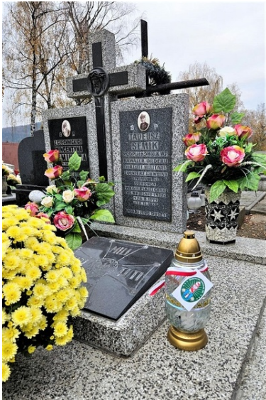
Karpacki Oddział Straży Granicznej pamięta o tych, którzy odeszli

Cmentarz komunalny w Nowym Sączu - grób śp. ppłk Mariana Serafiniuka - ostatniego dowódcy 1 Pułku Strzelców Podhalańskich.