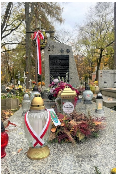
Karpacki Oddział Straży Granicznej pamięta o tych, którzy odeszli

Cmentarz komunalny w Zakopanem - Kwaterna Legionowa, w której spoczywa m.in. gen. bryg. Mieczysław Ludwik Boruta-Spiechowicz (patron Placówki Straży Granicznej w Zakopanem) oraz kilkunastu legionistów w tym generałowie: Marian Januszajtis i Andrzej Galica.