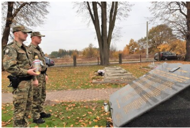
Karpacki Oddział Straży Granicznej pamięta o tych, którzy odeszli

Stary Cmentarz parafialny w Piwnicznej - obelisk upamiętniający Antoniego Sidełko, podoficera żołnierza Straży Granicznej, który 1 września 1939 r. zginął na posterunku granicznym. Był on prawdopodobnie pierwszą ofiarą II wojny światowej na Ziemi Sądeckiej.