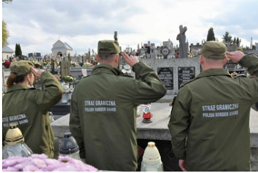
Karpacki Oddział Straży Granicznej pamięta o tych, którzy odeszli

Cmentarz komunalny w Lubaczowie - grób śp. płk. Przemysława Nakoniecznikoffa-Klukowskiego, patrona Placówki Straży Granicznej w Kielcach.