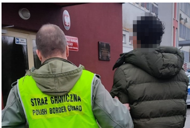
Amerykanka, obywatel Zimbabwe, Nepalczyk i Mołdavianin zatrzymani w Małopolsce, a Kolumbijczyk w województwie świętokrzyskim