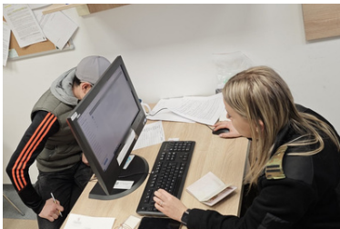
Amerykanka, obywatel Zimbabwe, Nepalczyk i Mołdavianin zatrzymani w Małopolsce, a Kolumbijczyk w województwie świętokrzyskim

Funkcjonariusze Placówki SG w Kielcach, w jednej z miejscowości w gminie Morawica, zatrzymali 30-letniego Kolumbijczyka. Mężczyzna nie wykonał decyzji powrotowej, wydanej przez Komendanta kieleckiej Placówki SG na początku sierpnia tego roku (cudzoziemiec miał 30 dni by opuścić Polskę oraz 6-miesięczny zakaz ponownego wjazdu). Na obywatela Kolumbii nałożono grzywnę w drodze mandatu karnego gotówkowego w kwocie 300 zł za niewykonanie obowiązku opuszczenia terytorium Rzeczypospolitej Polskiej w terminie wyznaczonym w decyzji o zobowiązaniu cudzoziemca do powrotu. Ponadto Komendant Placówki Straży Granicznej w Kielcach - do czasu wykonania decyzji o zobowiązaniu cudzoziemca do powrotu - zobowiązał cudzoziemca do zamieszkiwania w miejscu wyznaczonym w postanowieniu oraz zgłaszania się w każdą środę do Placówki Straży Granicznej w Kielcach. Dodatkowo jego dokument podróży został zatrzymany i przekazany do depozytu.