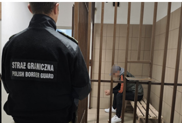
Amerykanka, obywatel Zimbabwe, Nepalczyk i Mołdavianin zatrzymani w Małopolsce, a Kolumbijczyk w województwie świętokrzyskim