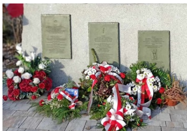
Uzczono 80. Rocznicę zrzutów alianckich dla 1 Pułku Strzelców Podhalańskich Armii Krajowej