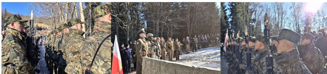
Uzczono 80. Rocznicę zrzutów alianckich dla 1 Pułku Strzelców Podhalańskich Armii Krajowej

Uroczystość odbyła się 29 grudnia br. na Zrzutowisku „Wilga” Polanki w Szczawie. Punktualnie o godz. 12.00 przy obelisku upamiętniającym wydarzenie odegrano i odśpiewano Hymn państwowy, odczytano apel pamięci, złożono wiązanki i znicze. Funkcjonariusze Wydziału Odwodowego (Reprezentacyjnego) Karpackiego Oddziału SG oddali salwę honorową. Podczas wydarzenia zaprezentowano inscenizację historyczną nawiązującą do wydarzeń sprzed 80 lat i przedstawiono historię zrzutowiska „Wilga”.