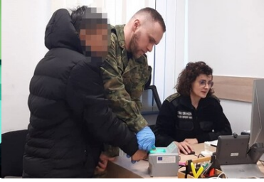
27 cudzoziemców przebywało w naszym kraju nielegalnie