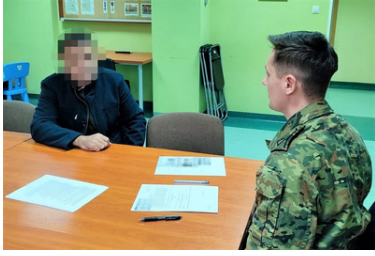
27 cudzoziemców przebywało w naszym kraju nielegalnie