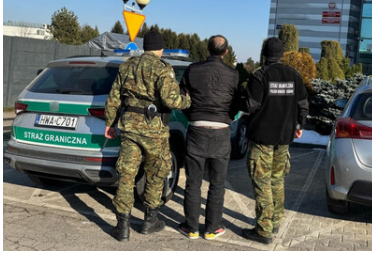
Zatrzymani za nielegalny pobyt i pracę