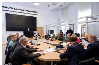
Działania funkcjonariuszy KaOSG w związku z zagrożeniem występowania pryszczycy na terenie Małopolski

Zaraz po stwierdzeniu ogniska pryszczycy na terenie Węgier 7 marca 2025 r. zostało zwołane przez Wojewodę Małopolskiego posiedzenie Wojewódzkiego Zespołu Zarządzania Kryzysowego. Wzięły w nim udział wszystkie służby i instytucje odpowiedzialne za bezpieczeństwo w Małopolsce, w tym Karpacki Oddział Straży Granicznej im. 1 Pułku Strzelców Podhalańskich.