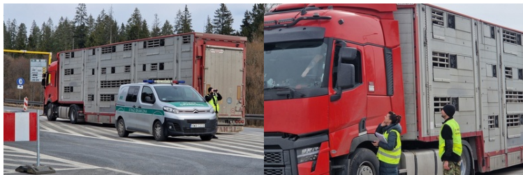
Działania funkcjonariuszy KaOSG w związku z zagrożeniem występowania pryszczycy na terenie Małopolski

Od początku działań Karpacki Oddział Straży Granicznej zadysponował 46 funkcjonariuszy i 23 pojazdy służbowe. Skontrolowano 343 pojazdy.