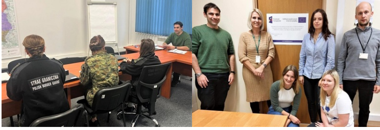
Funkcjonariusze Karpackiego Oddziału Straży Granicznej "szlifują" język angielski dzięki dofinansowaniu z FAMI